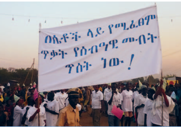
Manifestation «Les violences faites aux femmes sont une atteinte aux droits de l'homme»